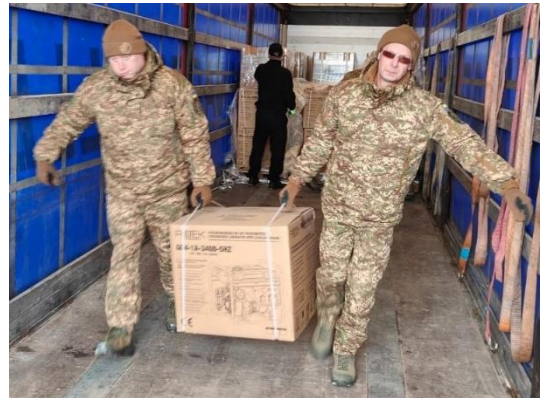
Polizei und Nationalgarde unterstützen beim Entladen, weil keine Menschen mehr da sind, die Kraft haben, anzupacken.